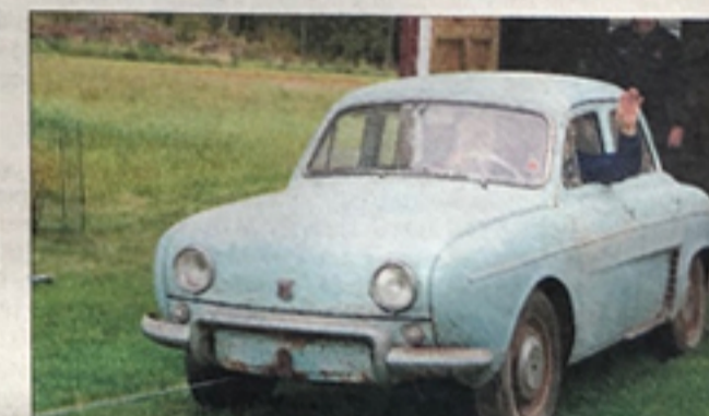
SISTE TUR: Jørn Hilmar Fundingsrud satt selv ved rattet da hans gamle bil, Renault Dauphine 1962-modell, ble tauet ut av uthuset.